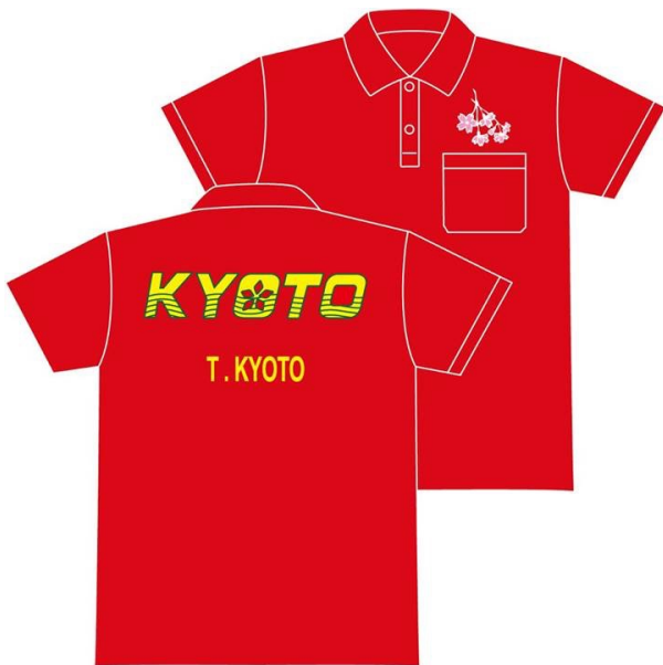
サブユニフォーム (赤)