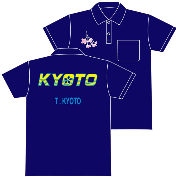
メインユニフォーム (紺)