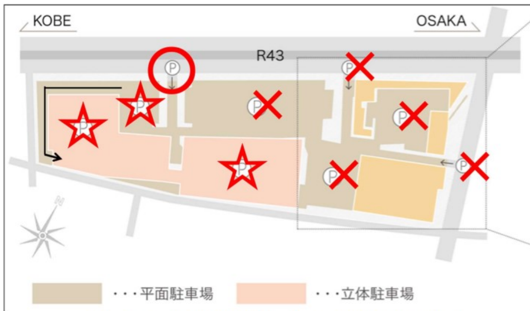
(サザンモール六甲 B612 ホームページより転載・加工)

(ハーレーダビッドソン側の第 1 駐車場(×印の箇所)には、 最大料金が適用されません。 )