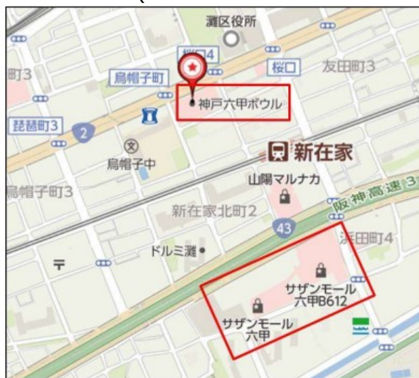
会場周辺地図(Yahoo! JAPAN 地図より転載)

★大会期間中は、「サザンモール六甲 B612 第 2 駐車場 」をご利用下さい。 (会場より徒歩 10 分)